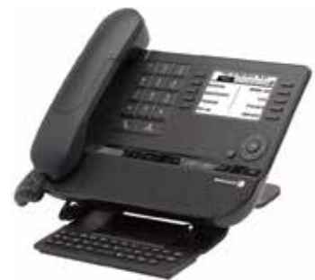
8038 Premium DeskPhone

Unser Unternehmen ist ein führender Anbieter von Kommunikationslösungen und -services für Unternehmen, vom Büro bis hin zur Cloud, die unter der Marke Alcatel-Lucent Enterprise vertrieben werden. Mit weltweit über 2.700 Mitarbeitern in über 100 Ländern und unserem Hauptsitz in der Nähe von Paris, Frankreich, vertrauen wir auf unseren innovativen und unternehmerischen Grundgedanken. Unser Team aus Technologieexperten, Service-Profis und über 2.900 Partnern ist mit Kommunikations-, Netzwerk- und Cloud-Lösungen für Unternehmen aller Größenordnungen für weltweit über 830.000 Kunden da und hilft ihnen, unsere Lösungen und Dienstleistungen an die lokalen Gegebenheiten anzupassen. Gemeinsam mit unseren Partnern erschaffen wir ein individualisiertes Benutzererlebnis, das unseren Kunden und deren Endanwendern greifbare Ergebnisse liefert.