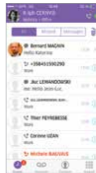
OpenTouch Conversation für iPhone