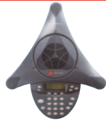
SoundStation® IP 4000

Das kleinste und preiswerteste Konferenztelefon für Besprechungen mit mehreren Teilnehmern. Ideal für Büros und kleine bis mittelgroße Konferenzräume.