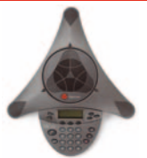
SoundStation VTX 1000™

Direkte Anbindung an digitale Nebenstellenanlagen von Nortel und AVAYA. Keine gesonderten analogen Endgeräte-Adapter erforderlich.