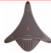
SoundStation Premier® 500D/550D

Überall einsetzbar, wo es auf Teamarbeit ankommt, selbst in Räumen ohne Telefonanschluss.