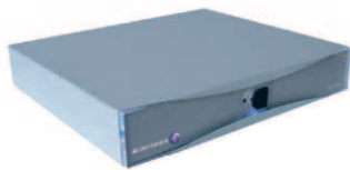
Extended Communication Server Compact Edition

Der Alcatel-Lucent Extended Communication Server (ECS) bietet kleinen und mittelständischen Unternehmen (KMU) ein innovatives Konvergenzkonzept und stellt eine einfache Informationsmanagement- und Kommunikationslösung dar, die leicht zu implementieren und zu verwalten ist. Der ECS ist eine Lösung, mit der die Art und Weise verändert wird, auf die kleine und mittlere Unternehmen kommunizieren, indem er vollständig integrierte Kommunikations-, Zusammenarbeits- und Mobilitätslösungen bietet, die skalierbar, zuverlässig und kosteneffizient sind.